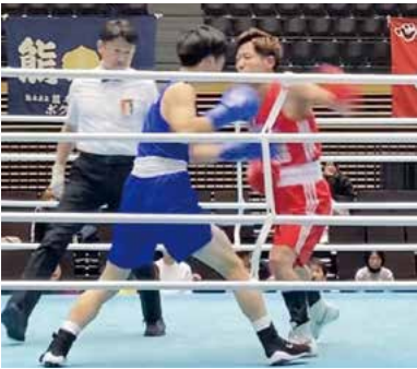
迫力ある試合中の一コマ

それから、仕事の合間を縫ってコツコツとトレーニングを続け、平成30年(2018年)に長崎県で開催された全日本社会人選手権では、準優勝することができました。この時期に転職が決まったこともあり、準優勝できたことがいい区切りだと思い、現役を引退することにしました。