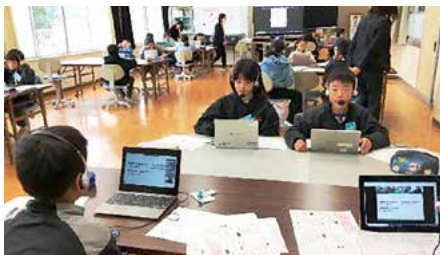
4年 他県とのリモート交流

書き初めで「明るい心」を書きました。字のバランスを考えながら、集中して取り組みました。