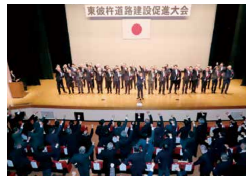
約500人が出席しました