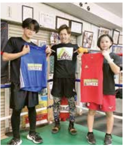
興味がある方は、ぜひチャレンジしてみてください!

「ボクシング」と聞くと、やや暴力的なイメージを持つ人もいるかと思いますが、実際はそんなことはなく、自分を追い込んで忍耐力や粘り強さを培うことができる競技です。最近ではフィットネス感覚で始める女性の方やお子さんもいらっしやいます。自分には無理だと思わず、興味がわいたら迷わずに門を叩いてほしいと思います。