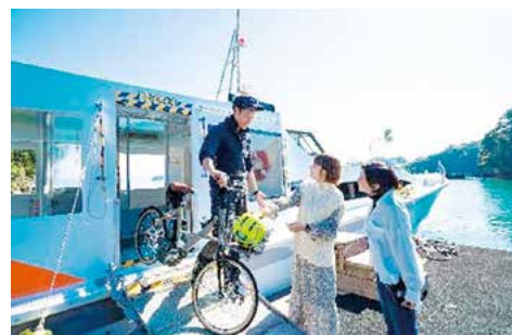
自転車をサイクルステーションでレンタルして一緒に船へ