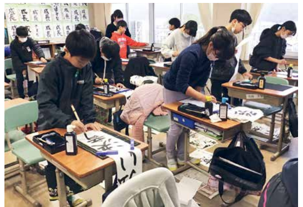
真剣な眼差しで取り組んでいます。(5年生)

川棚小では新しい年への希望を込めて、創作の喜びを味わうことを目的に毎年実施しています。