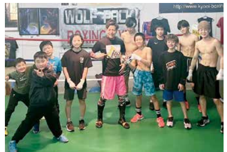
後輩たちの指導・育成にも力を入れています

その後は仕事の傍らジムで後輩たちの指導をしていたのですが、自分の中でスキル的にはまだまだやれる感覚があったし、現役を離れて俯瞰的にボクシングに携わることによって、新たな視点を持つことができるようになっていきました。