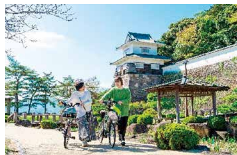
歴史ある城下町を自転車で散策