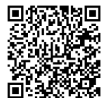
長崎県ホームページ