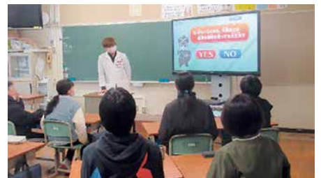
6年 薬物乱用防止教室