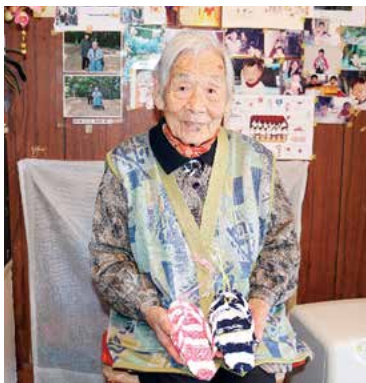
手作りのわらじを持ち、お孫さんたちの写真に囲まれて笑顔のマシさん