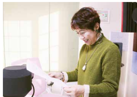
放送前にメモのチェック

信が終了の時間に。帰り際、ゲストさんからの「楽しかった。また出るけんね」の言葉が嬉しいですね。