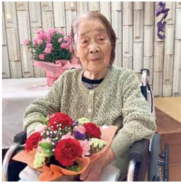
プレゼントのお花を手に、嬉しそうな表情のイチさん