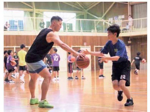
同じコートに立ち、熱心に指導していただきました