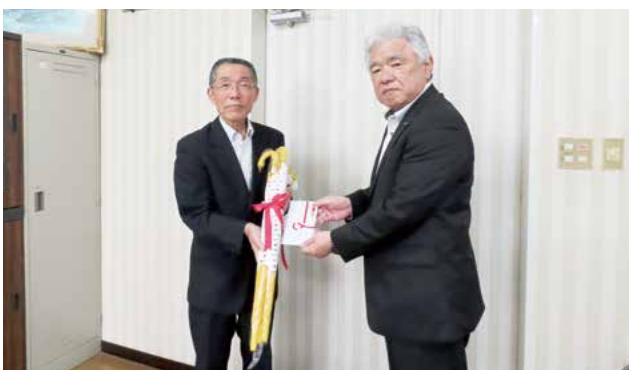
(写真左から) 諸岩教育長、JAながさき県央 里山代表理事専務

これはJA共済事業の地域貢献活動の一環として、子どもの交通安全に対する意識の向上を目的に行われているものです。