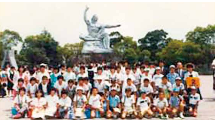
川棚小学校で教頭を務めていた時に、平和学習で平和公園を訪れた際の様子