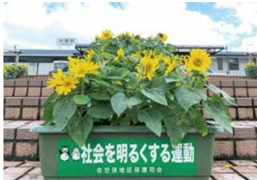
7月には綺麗な花を咲かせました