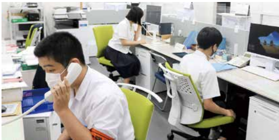
総務課内で電話の取次ぎ