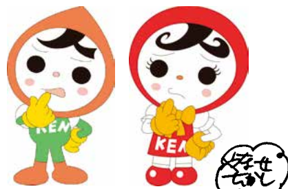
人権メッセージキャラクター 人KENまもる君・人KENあゆみちゃん