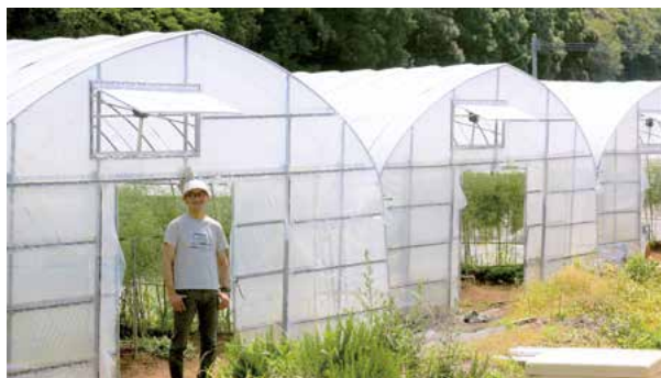
総面積は26a、13棟のハウスで栽培しています

ほとんどが町外に出荷されるため、町内で見かける機会は少ないかもしれませんが、ふるさと納税にも出品しているため、町外にお住まいの知人・友人にぜひおすすめしていただければと思います。