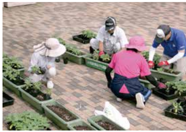
駅前広場での植樹の様子