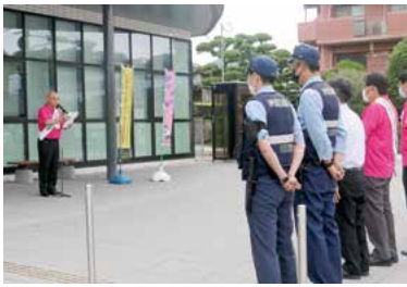
出発式で挨拶する波戸町長

※社会を明るくする運動とは、犯罪や非行のない安全で安心な明るい地域社会を築くための全国的な運動であり、ヒマワリは、更生保護のシンボルとされています。