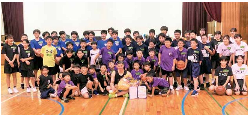
参加者全員での記念撮影