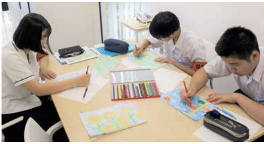
「川棚といえば」というテーマでイラスト制作

今回の職場体験学習を通して、電話の取次ぎや職場がどのようなものなのか分かりました。とてもいい経験をさせていただいたと思います。本当に3日間お世話になりました。