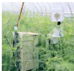
さまざまな機械を導入し、コスト削減・省力化を図っています