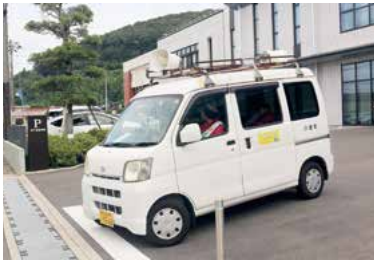
車両パレードの様子