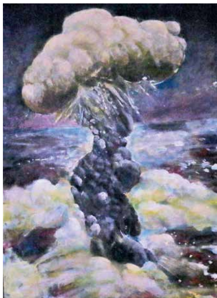
娘婿が描いてくれた“きのこ雲”の絵。講演活動の際に持ち回っています

防空壕に入って改めて自分の体を見てみたところ、私は原子爆弾がさく裂した瞬間、爆心地に背中を向ける形で立っていたため、手や後頭部、首など肌が露出していた部分をひどくやけどしていました。また、着衣していたにもかかわらず、背中からお尻にかけて身体の後ろ半分をやけどしていました。他にも指の一本一本が膨れ上がるほど水膨れしており、服と服