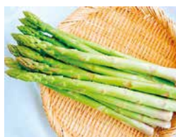
強い甘さと柔らかさが特徴です