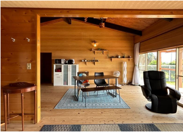
●リビングダイニング