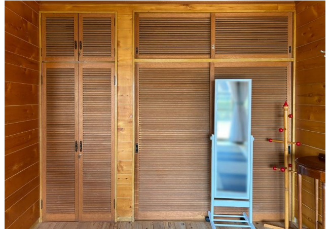
●リビングダイニング 収納